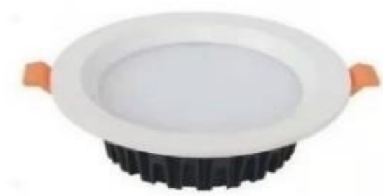
Жагсаалт №3-н бодит зураг