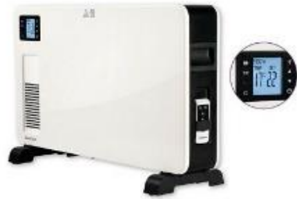
Жагсаалт №4-н бодит зураг